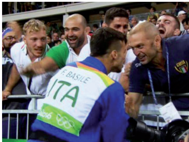
In alto: Fabio Basile e Pierangelo Toniolo a Rio 2016

Per questo dobbiamo ringraziare Fabio Basile e tutti i judoka dell'Akiyama, quelli che per 40 anni l'hanno praticato e quelli che ancora lo praticano, perché hanno riconsegnato al judo la dignità che merita sottolineando un fatto, in fondo, già risaputo: judoka si diventa e lo si resta tutta la vita.