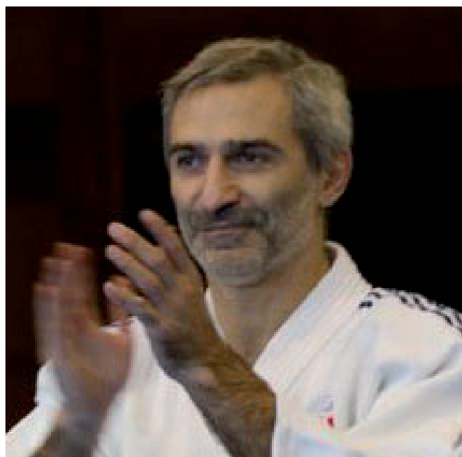
In alto e in basso: Raffaele Toniolo