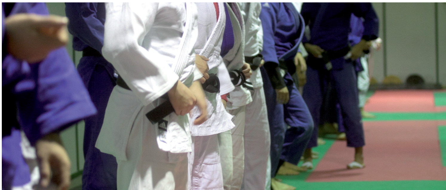
In basso: Il saluto d'inizio allenamento