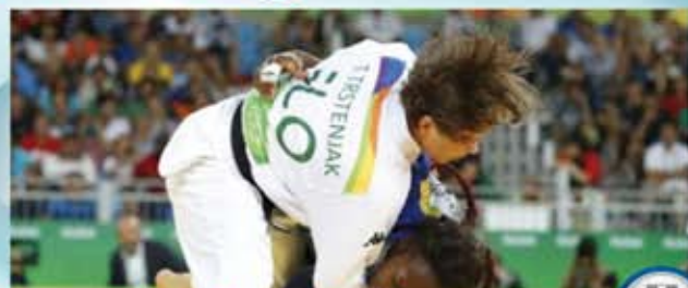
Tina Trstenjak SLO = 63kg

CAMP.SSA OLIMPICA 2016 CAMP.SSA DEL MONDO 2015 CAMP.SSA D'EUROPA 2016