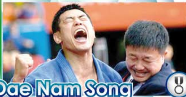
Dae Nam Song KOR = 90kg

CAMPIONE OLIMPICO 2012 VINCITORE GRAN SLAM PARIGI 2009 VINCITORE GRAN SLAM TOKYO 2007 ALLENATORE NAZIONALE KOREANA